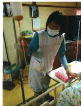
胃ろうからの 栄養注入の様子